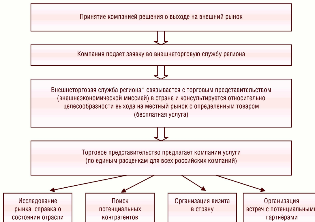
Рисунок 2. Алгоритм взаимодействия экспортёров, региональных и федеральных органов власти для вывода товаров на внешний рынок

* В качестве внешнеторговой службы региона может выступать как специализированный орган регулирования ВТД региона, так и подразделение департамента экономики или другого департамента, в компетенции которого находится регулирование внешней торговли региона.